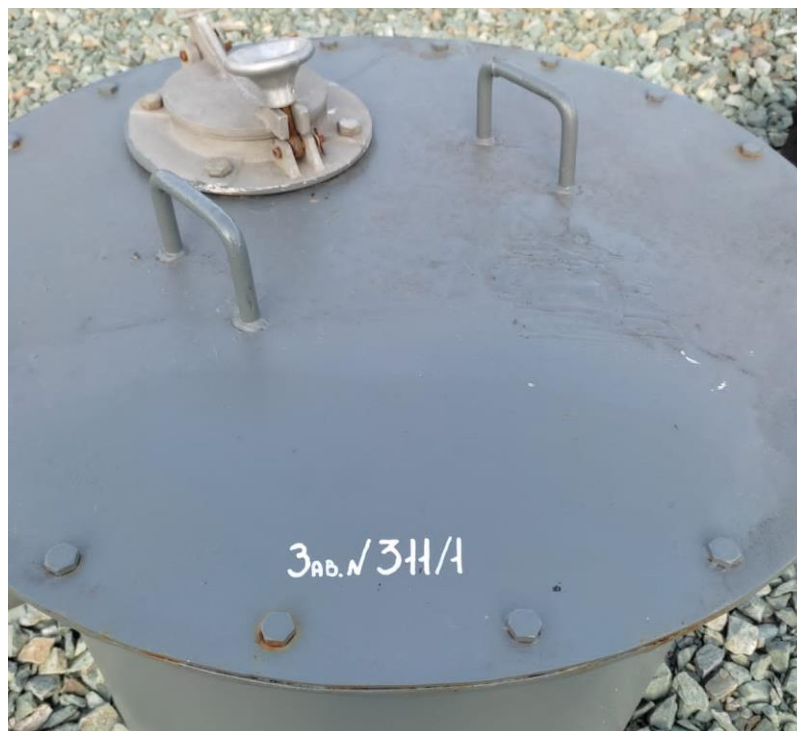
Рисунок 1 – Место нанесения заводского номера