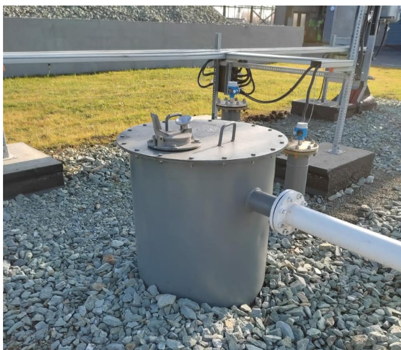
Рисунок 2 – Общий вид резервуара РГСП-200