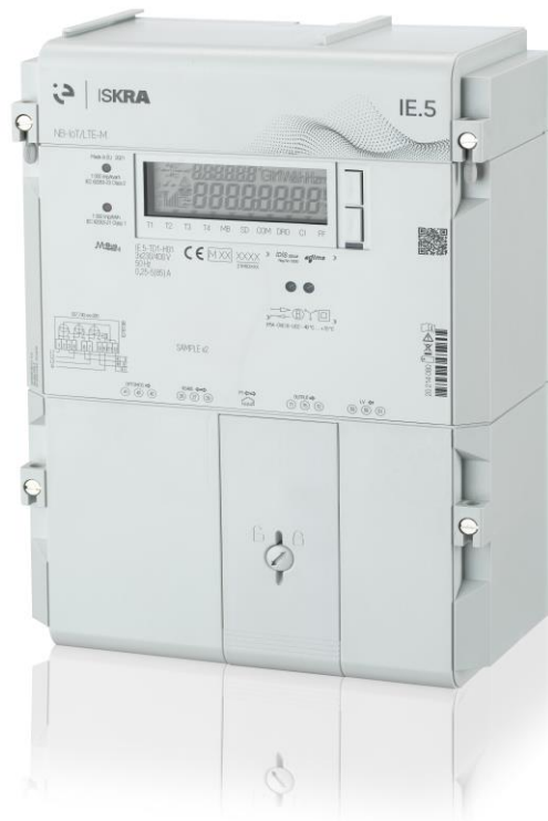
Рисунок 1 - Общий вид счетчиков электрической энергии трехфазных многофункциональных IE.5-T

Схема пломбировки от несанкционированного доступа, обозначение места нанесения знака поверки представлены на рисунке 2.