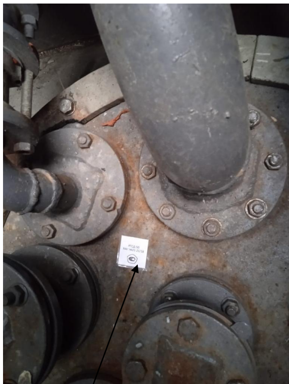
РГСД-50 зав. № 21-21/18