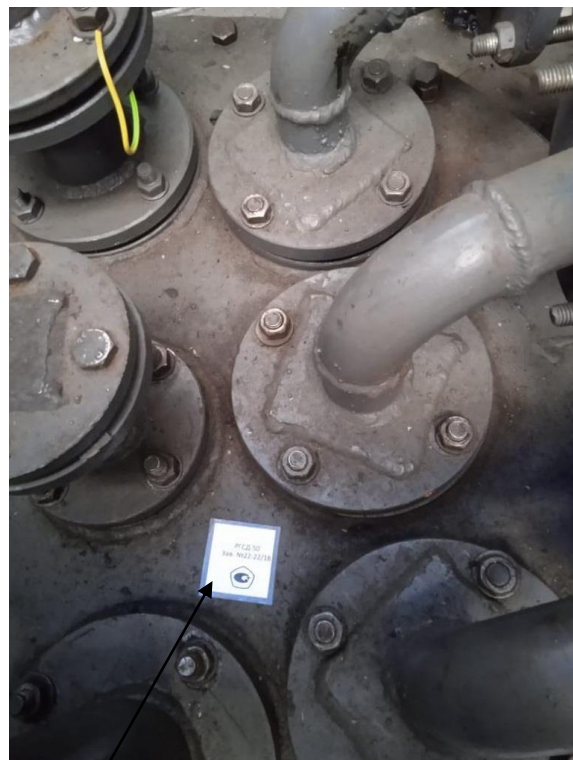
РГСД-50 зав. № 22-22/18