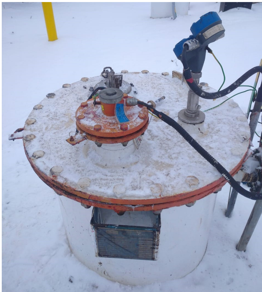
Рисунок 2 – Общий вид резервуара РГС-40