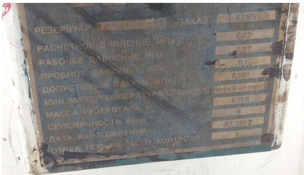
Рисунок 1 – Место нанесения заводского номера

Нанесение знака поверки на средство измерений не предусмотрено.