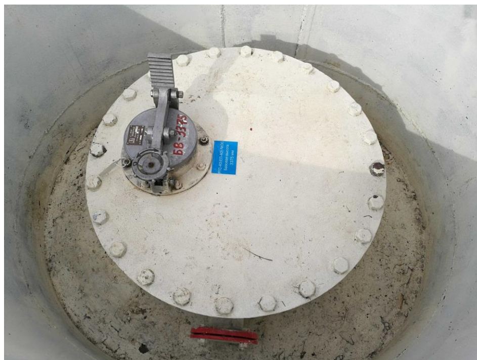
Рисунок 3 – Общий вид резервуара РГС-40