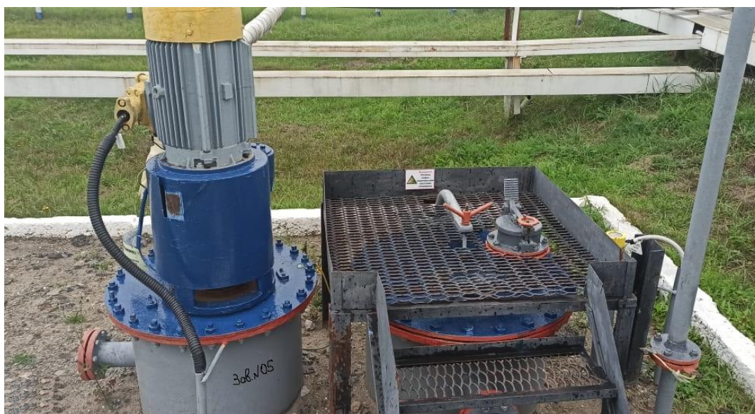
Рисунок 1 – Общий вид резервуара РГС-8

Нанесение знака поверки на средство измерений не предусмотрено.