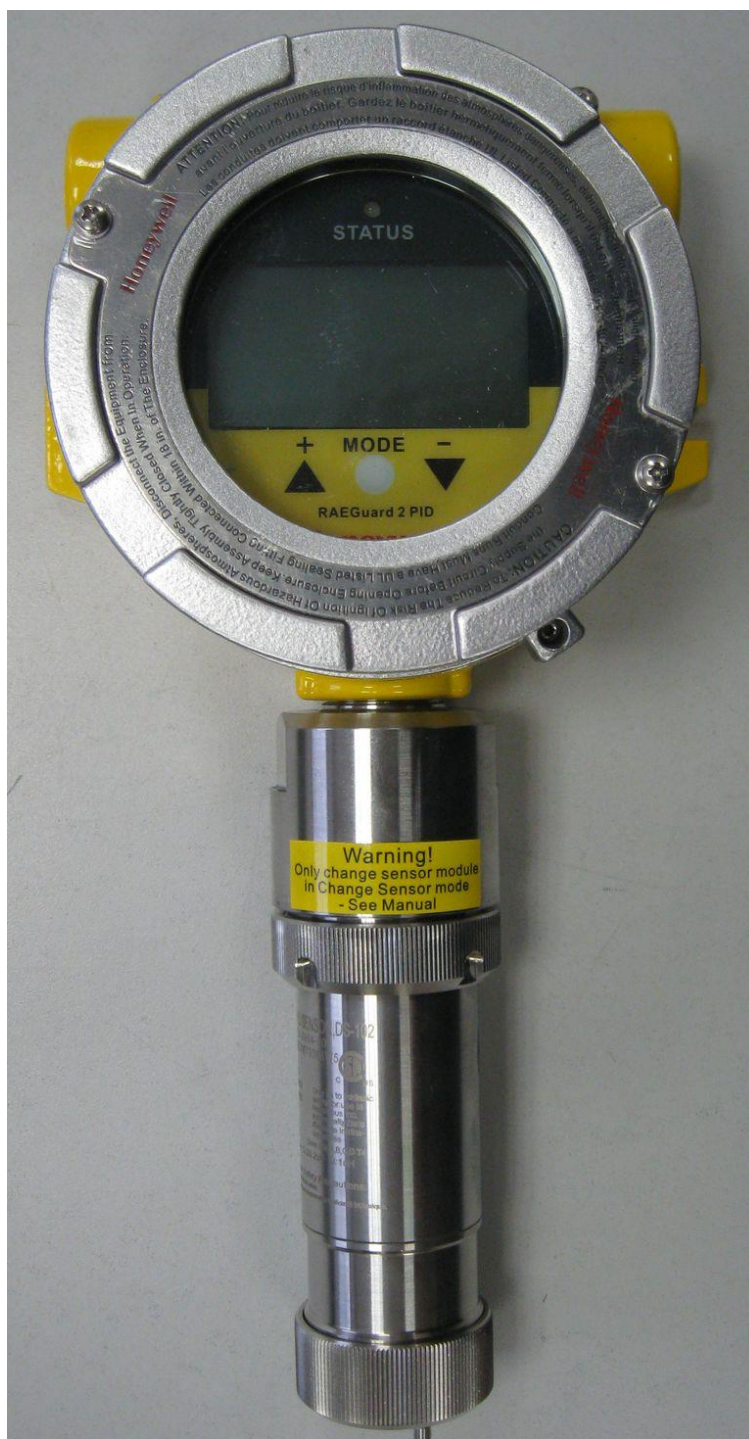
Рисунок 1 - Общий вид газоанализаторов