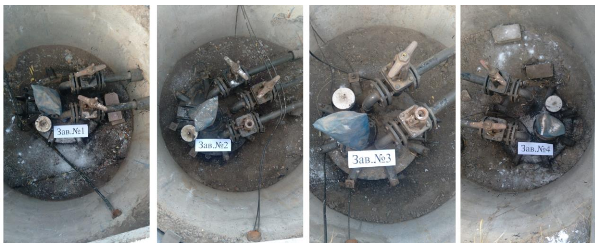
Рисунок 1 – Общий вид резервуаров РГС-60

Нанесение знака поверки на средство измерений не предусмотрено.