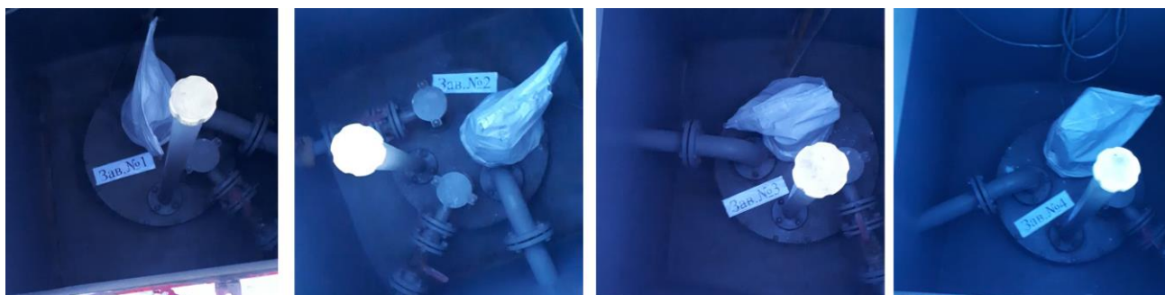
Рисунок 1 – Общий вид резервуаров РГС-50

Нанесение знака поверки на средство измерений не предусмотрено.