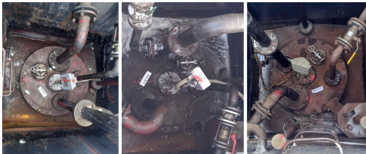
Рисунок 1 – Общий вид резервуаров РГС-25

Нанесение знака поверки на средство измерений не предусмотрено.