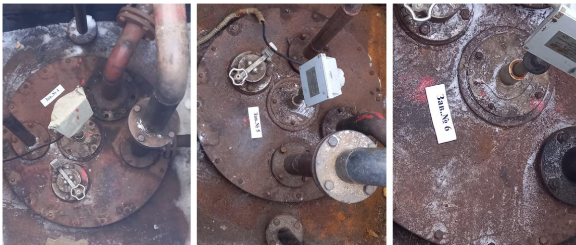
Рисунок 2 – Общий вид резервуаров PGC-25