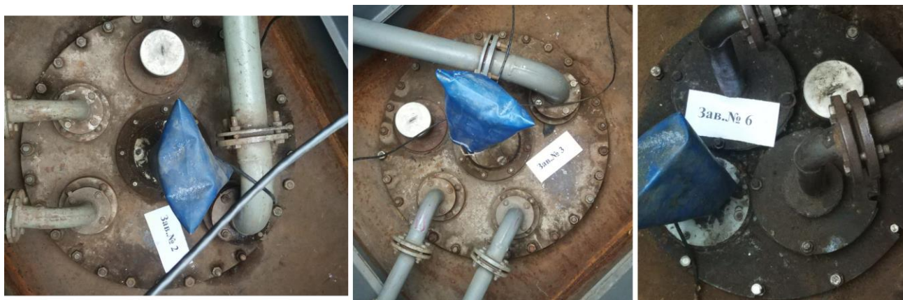
Рисунок 1 – Общий вид резервуаров РГС-25

Нанесение знака поверки на средство измерений не предусмотрено.