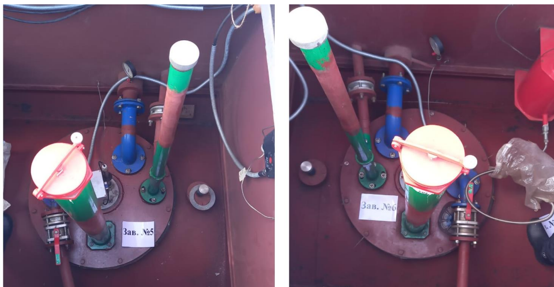
Рисунок 2 – Общий вид резервуаров РГС-25