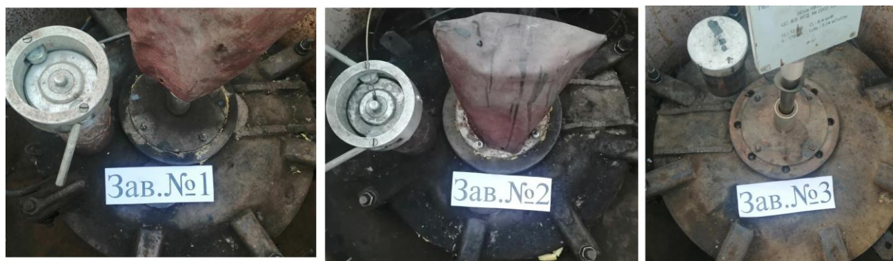
Рисунок 1 – Общий вид резервуаров РГС-60

Нанесение знака поверки на средство измерений не предусмотрено.