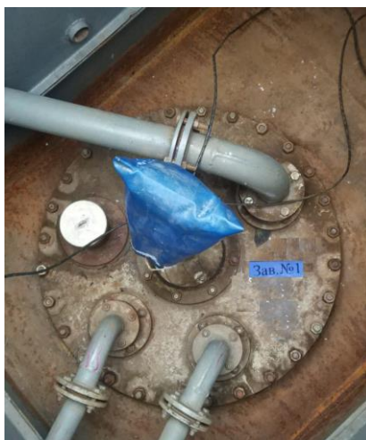
Рисунок 1 – Общий вид резервуара РГС-50

Нанесение знака поверки на средство измерений не предусмотрено.