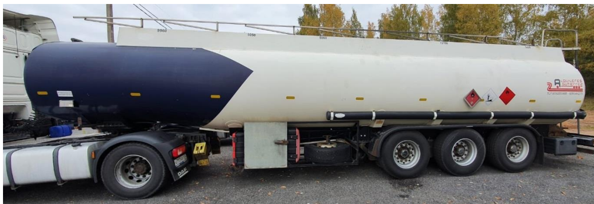
Рисунок 1 – Общий вид ППЦ INDOX заводской номер VS96T7820WT047142

Схема пломбировки от несанкционированного изменения положения указателя уровня налива, обозначение места нанесения знака поверки представлены на рисунке 2.