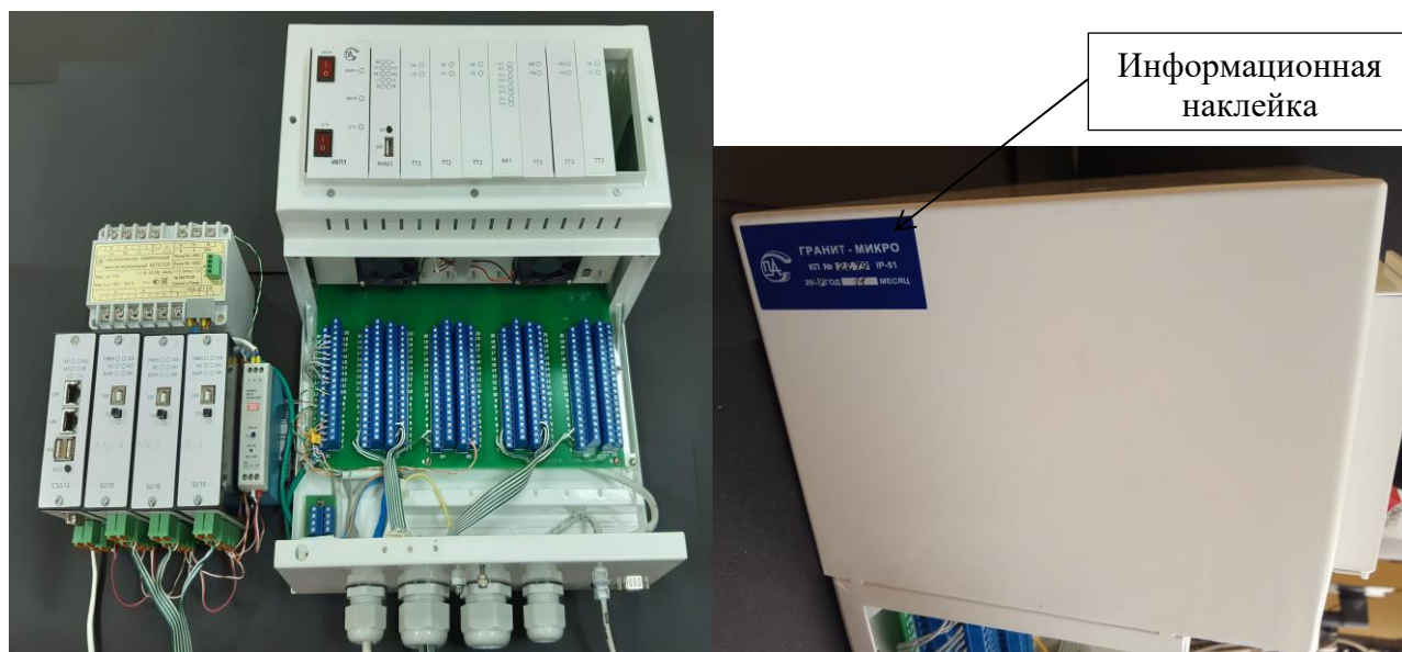
Рисунок 1 – Общий вид комплексов с местом нанесения информационной наклейки

Общий вид комплексов с местом нанесения информационной наклейки представлен на рисунке 1, общий вид модулей с местом нанесения серийного номера представлен на рисунке 2.