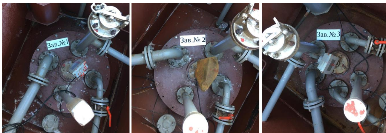
Рисунок 1 – Общий вид резервуаров РГС-25

Нанесение знака поверки на средство измерений не предусмотрено.