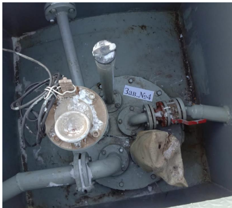
Рисунок 1 – Общий вид резервуара РГС-25