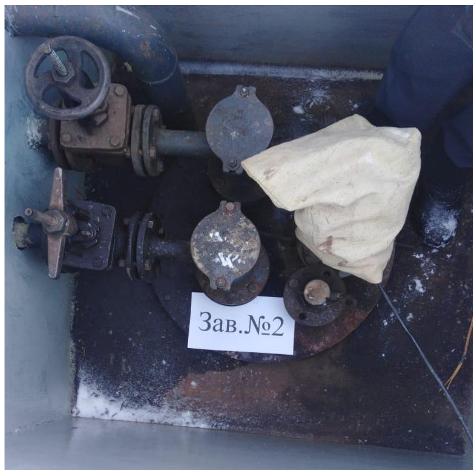
Рисунок 1 – Общий вид резервуара РГС-40