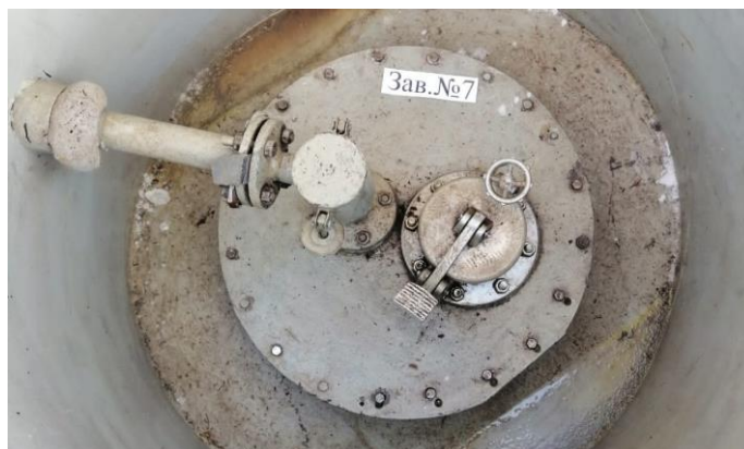
Рисунок 1 – Общий вид резервуара РГС-25

Нанесение знака поверки на средство измерений не предусмотрено.