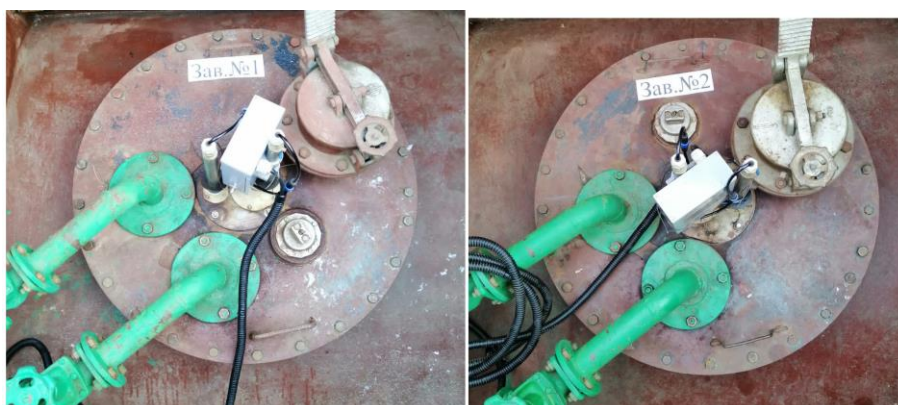
Рисунок 1 – Общий вид резервуаров РГС-25

Нанесение знака поверки на средство измерений не предусмотрено.