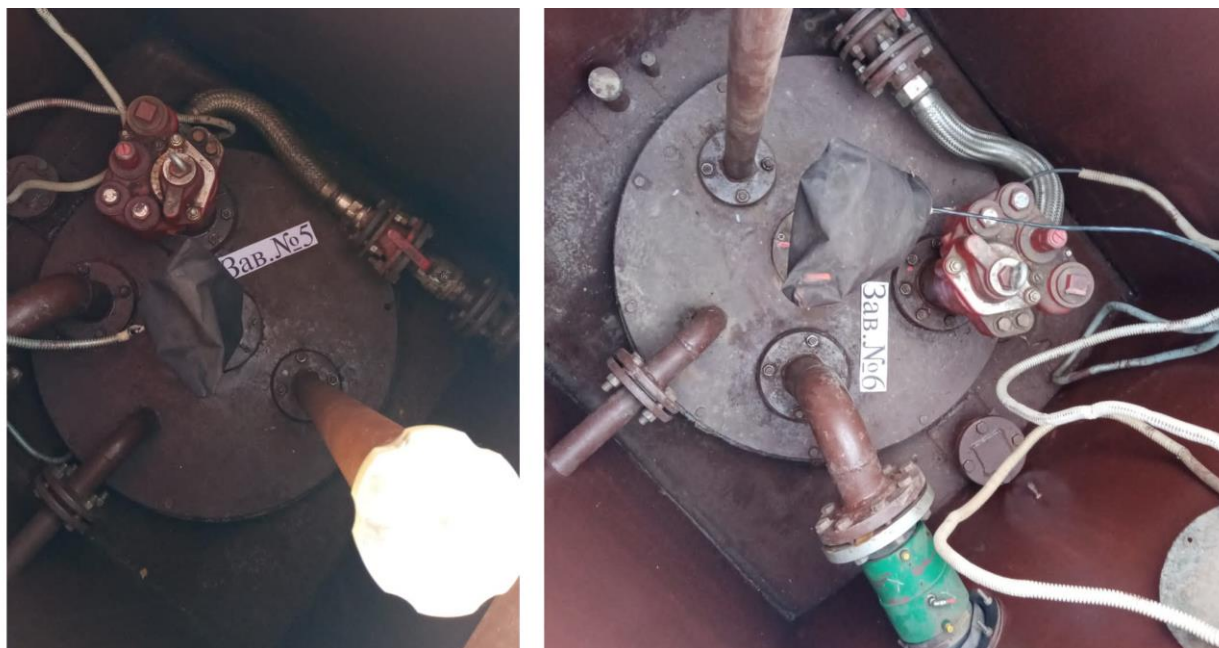
Рисунок 1 – Общий вид резервуаров РГС-25