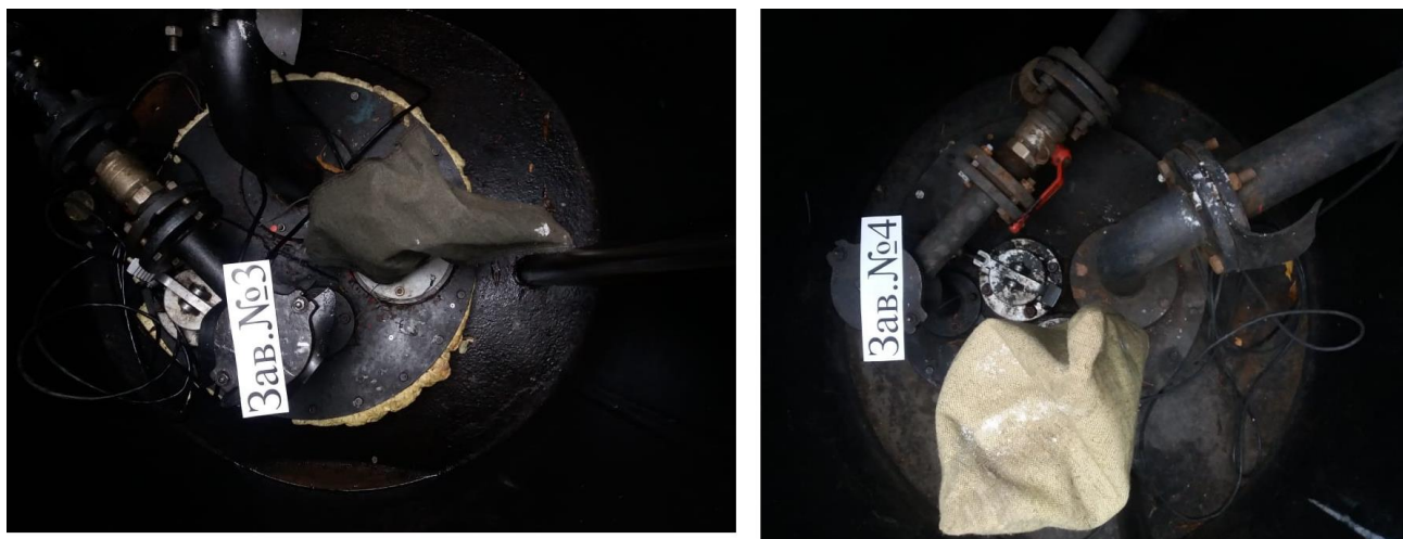
Рисунок 2 – Общий вид резервуаров РГС-25