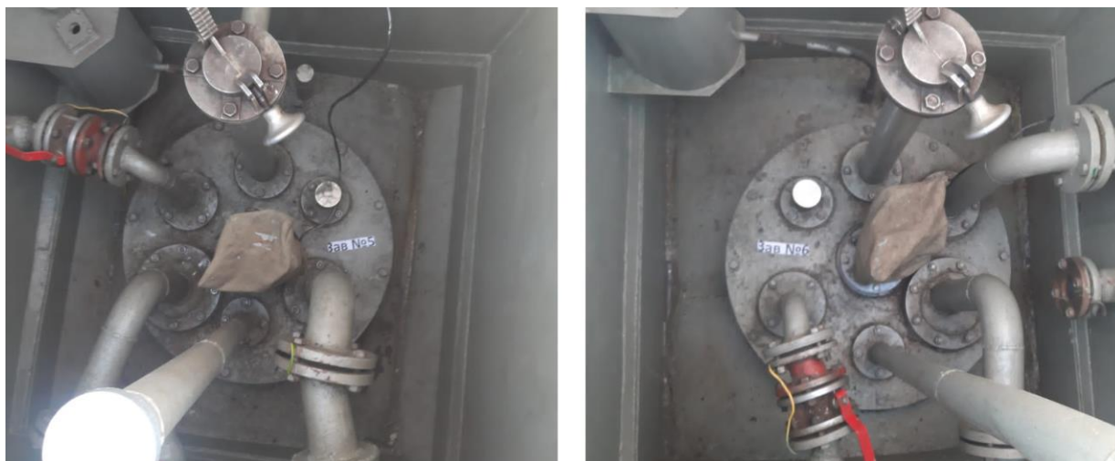
Рисунок 2 – Общий вид резервуаров РГС-50