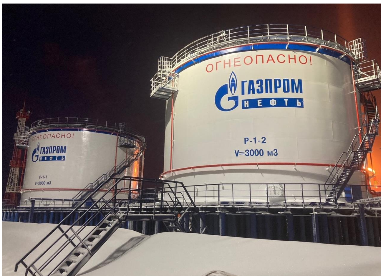
Рисунок 2 – Общий вид резервуаров PBC-3000

Пломбирование резервуаров PBC-3000 не предусмотрено.