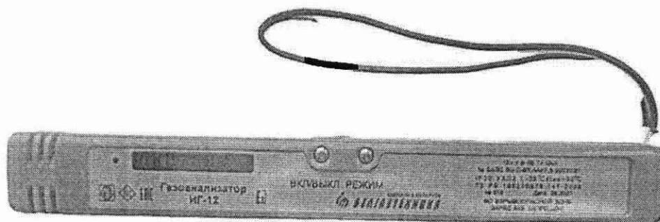
Рисунок 1.1 – Фотография общего вида газоанализаторов ИГ-12 (изображение носит иллюстративный характер)