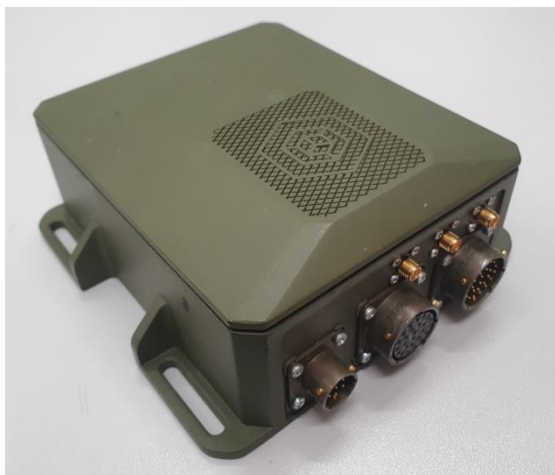
а) Аппаратный модуль АНТ

Общий вид терминала представлен на рисунке 1. Места нанесения знака утверждения типа и пломбировки от несанкционированного доступа приведены на рисунке 2.