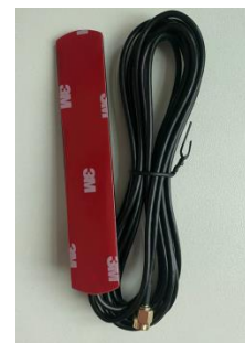
г) GSM/GPRS антенна