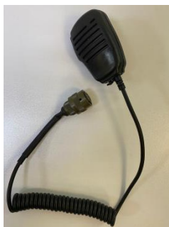
б) Телефонная гарнитура (тангента)