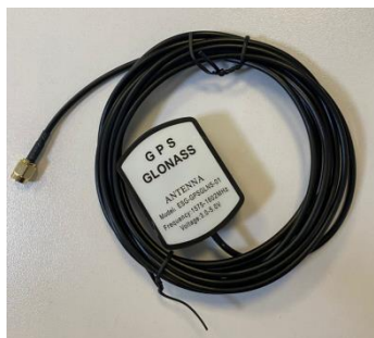
в) ГНСС антенна