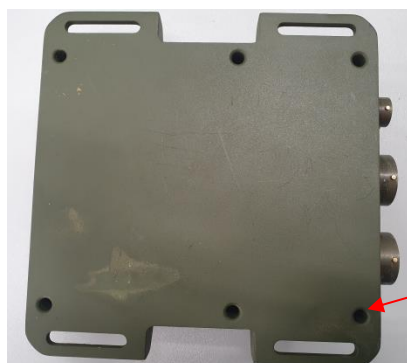
а) Задняя панель аппаратного модуля АНТ

Место пломбировки от несанкционированного доступа