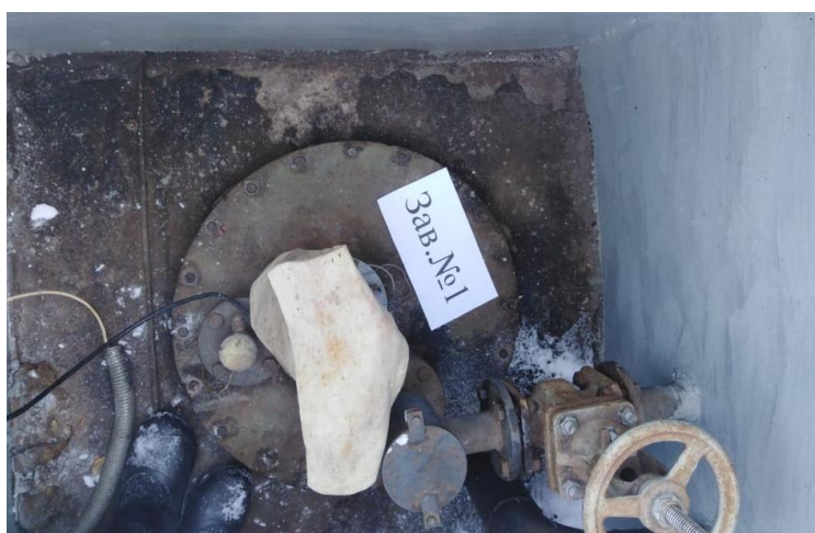
Рисунок 1 – Общий вид резервуара РГС-25

Нанесение знака поверки на средство измерений не предусмотрено.