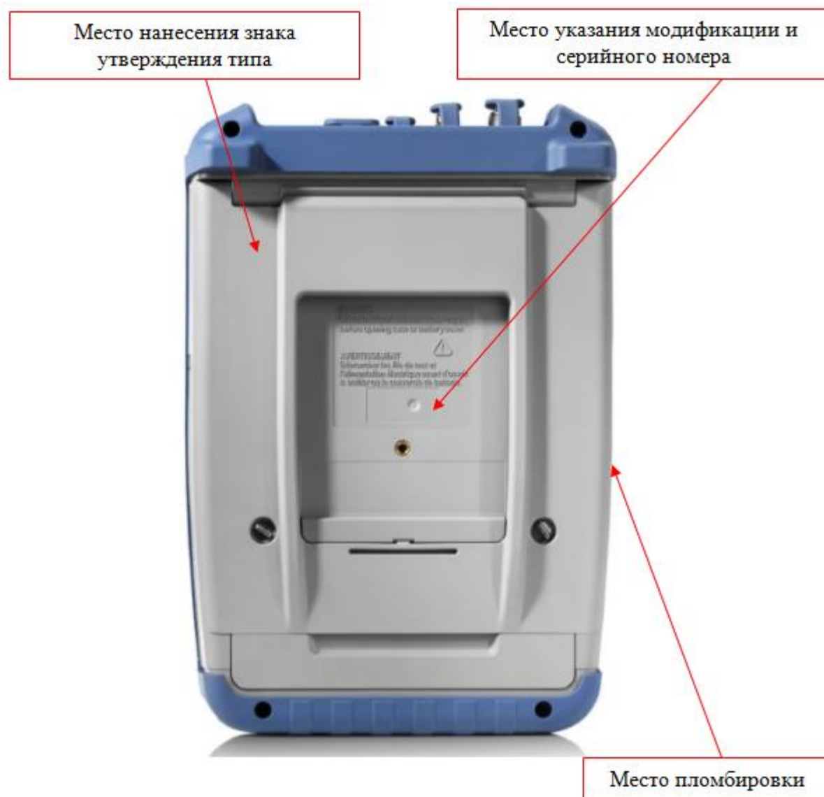
Рисунок 2 – Схема пломбировки от несанкционированного доступа и места нанесения серийного номера, идентифицирующего каждый экземпляр СИ, информации о модификации, а также знака утверждения типа