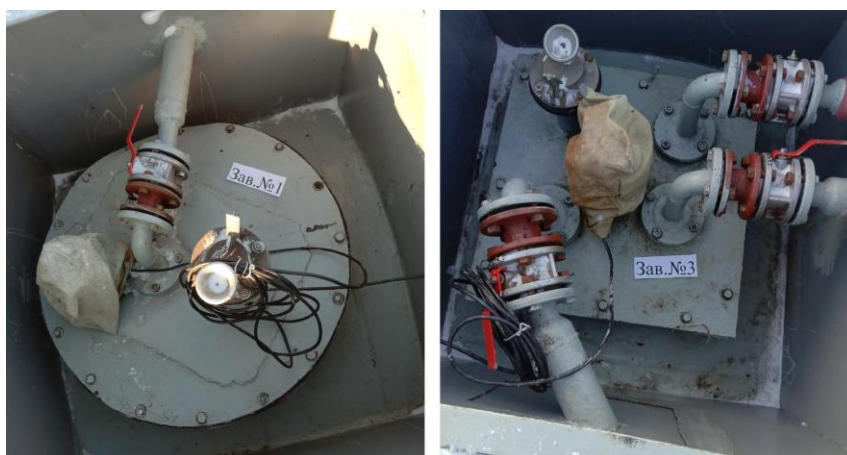
Рисунок 1 – Общий вид резервуаров РГС-50

Нанесение знака поверки на средство измерений не предусмотрено.