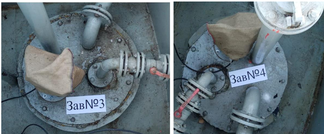
Рисунок 2 – Общий вид резервуаров РГС-25