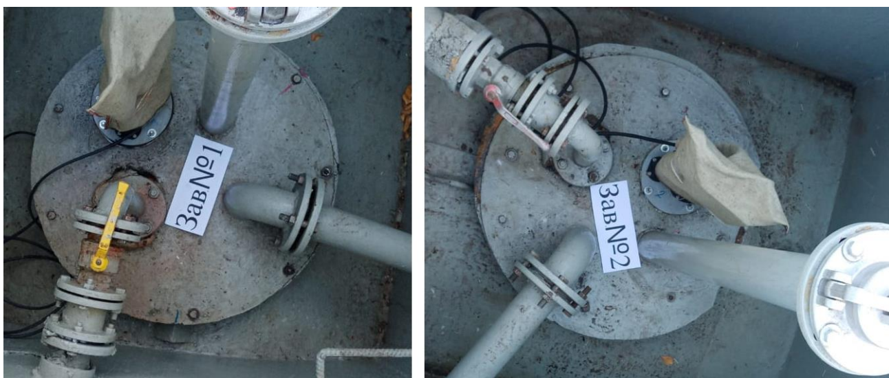
Рисунок 1 – Общий вид резервуаров РГС-25

Нанесение знака поверки на средство измерений не предусмотрено.