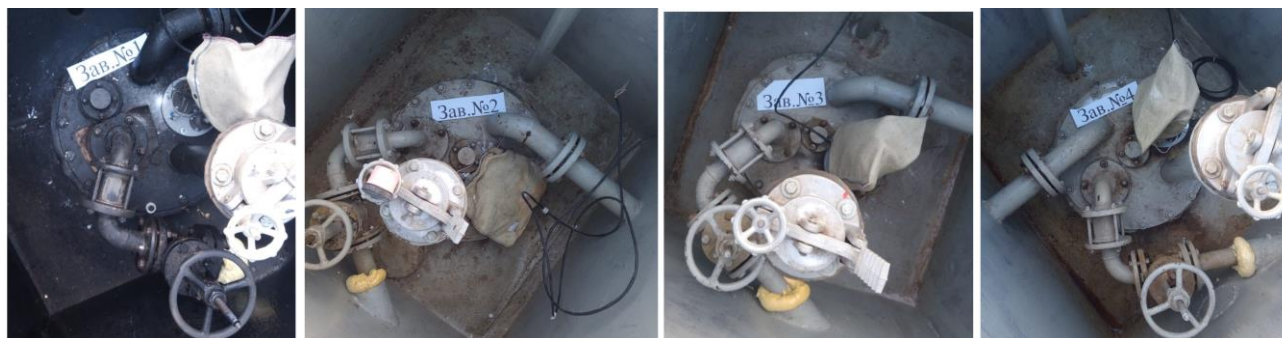
Рисунок 1 – Общий вид резервуаров РГС-25

Нанесение знака поверки на средство измерений не предусмотрено.