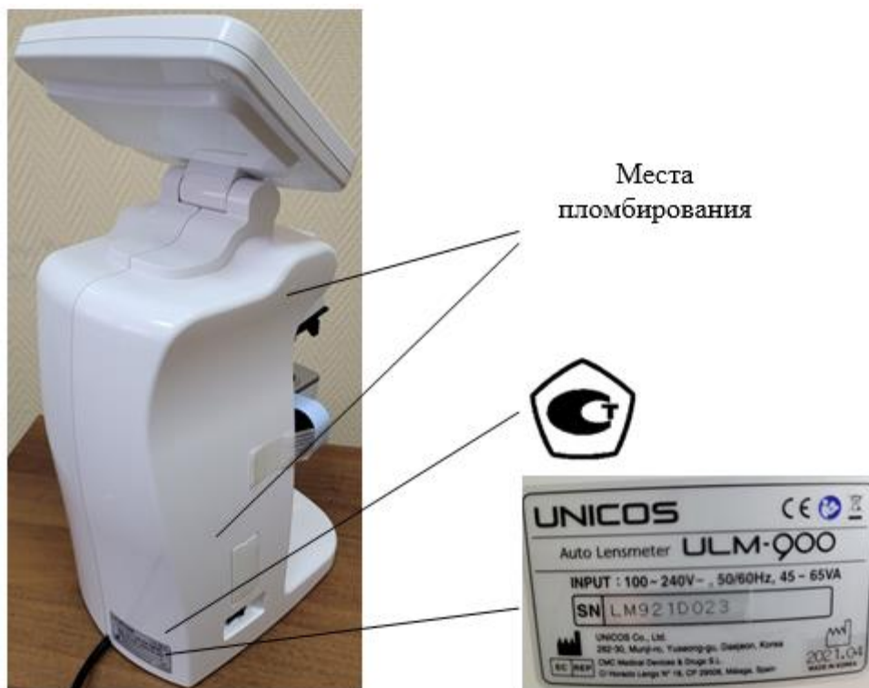
Рисунок 2 – Общий вид, схема маркировки и схема пломбирования от несанкционированного доступа линзметра ULM-900