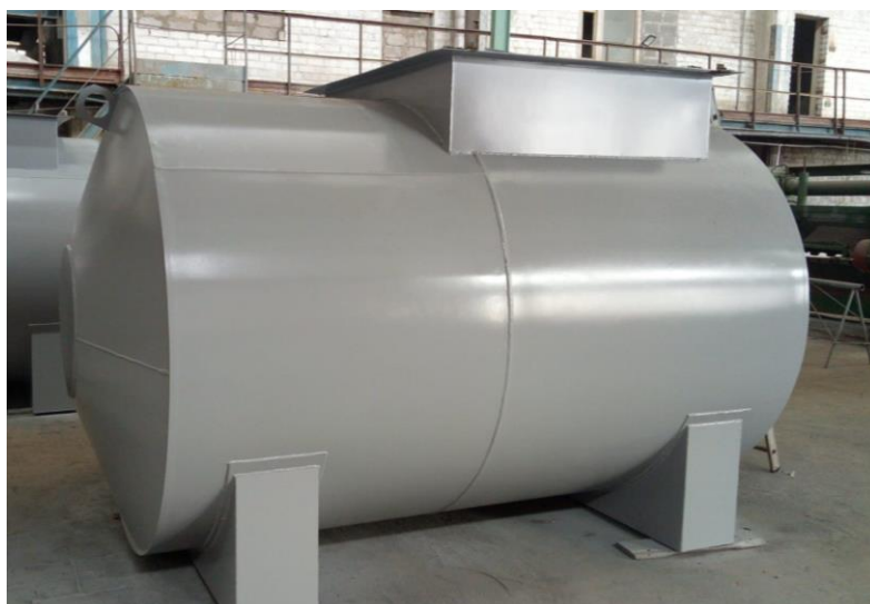
Рисунок 1 – Общий вид резервуара наземного исполнения

Место нанесения заводского номера представлено на рисунке 3.