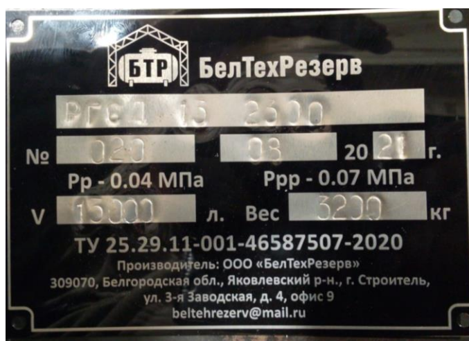
Рисунок 3 – Место нанесение заводского номера

Знак поверки наносится в градуировочной таблице в виде оттиска поверительного клейма.