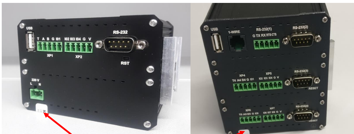
Рисунок 3 – Места установки изготовителем пломб-наклеек, вид спереди

Места установки изготовителем пломб наклеек, блокирующих доступ к технологическому разъему для прошивки КМ ЭНТЕК