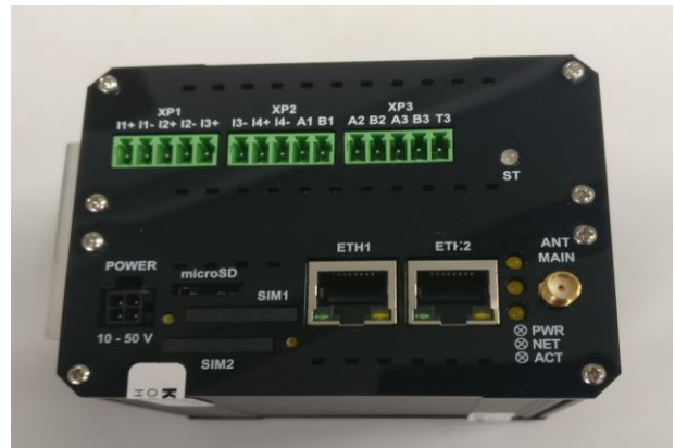
Рисунок 1 – Общий вид КМ ЭНТЕК. Место нанесения знака утверждения типа