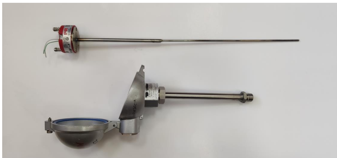
Рисунок 2 – Общий вид ТП в разобранном виде

Пломбирование ТП не предусмотрено. Заводской номер наносится на корпус ТП методом гравировки. Конструкция ТП не предусматривает нанесение знака поверки на средство измерений.