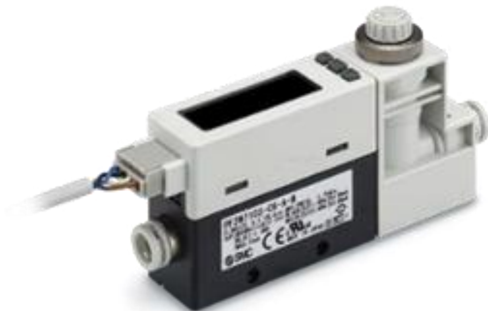
Рисунок 3 — Общий вид расходомеров PF2M