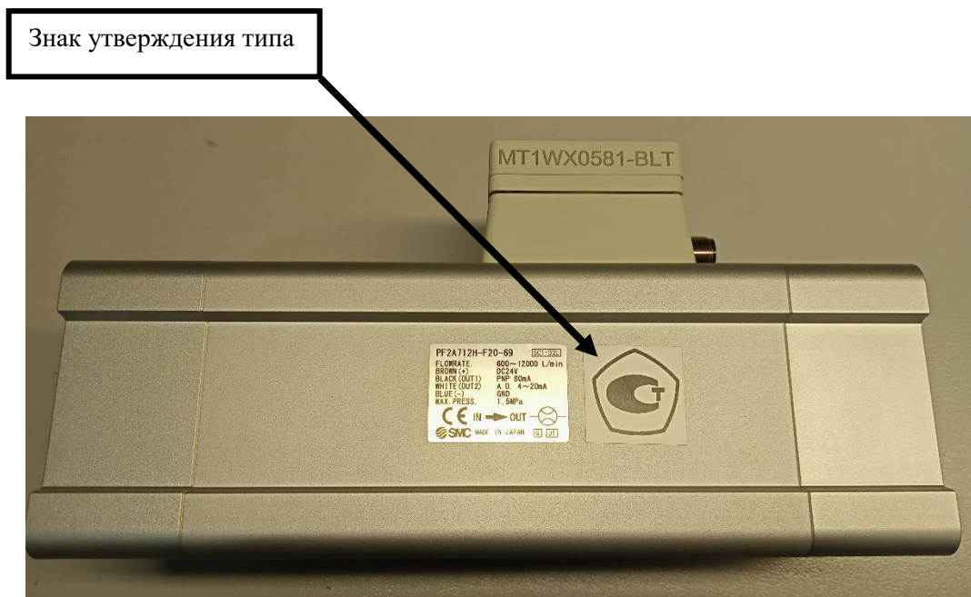
Рисунок 12 — Место нанесения знака утверждения типа