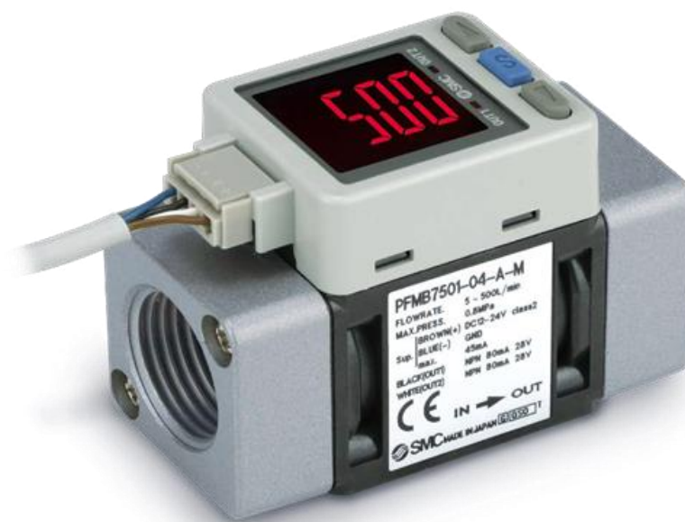
а) Исполнения 7501,7102,7202