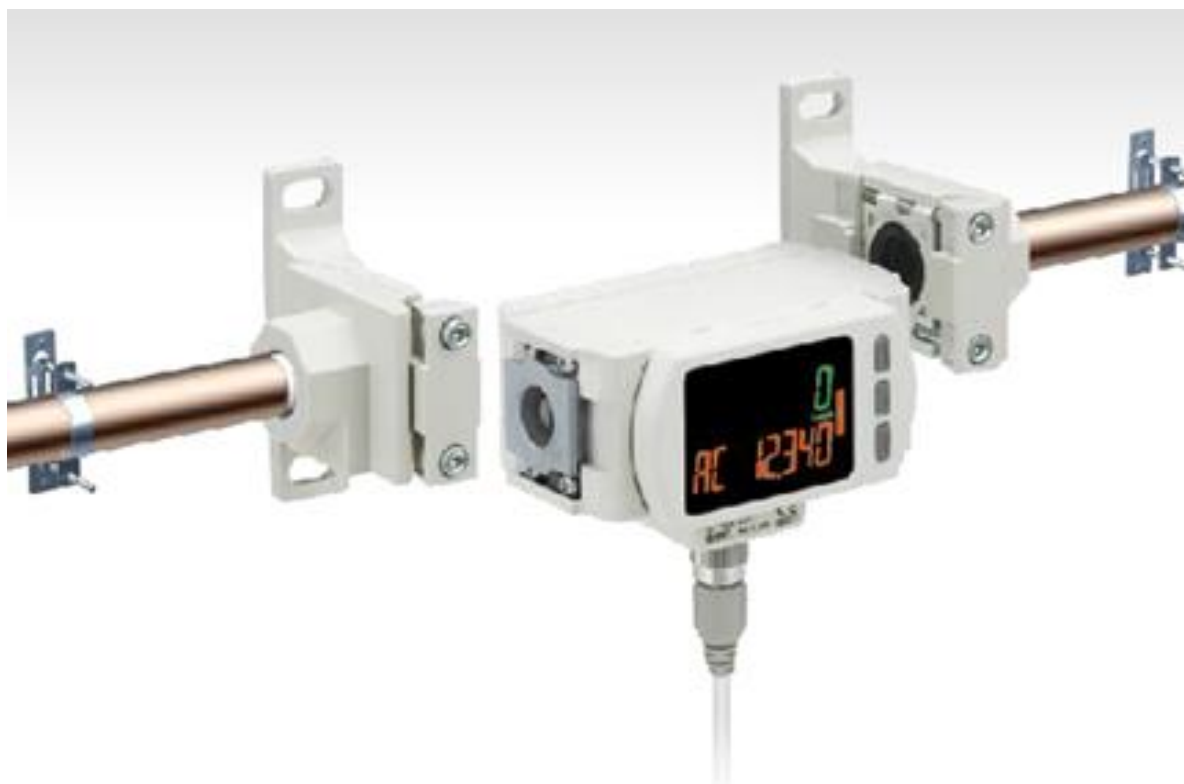
в) Монтаж расходомера модульного типа