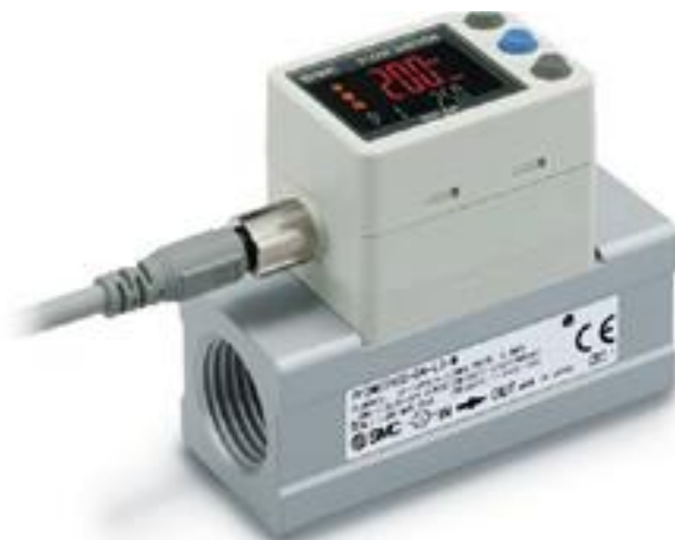
Рисунок 4 — Общий вид расходомеров PF2MC