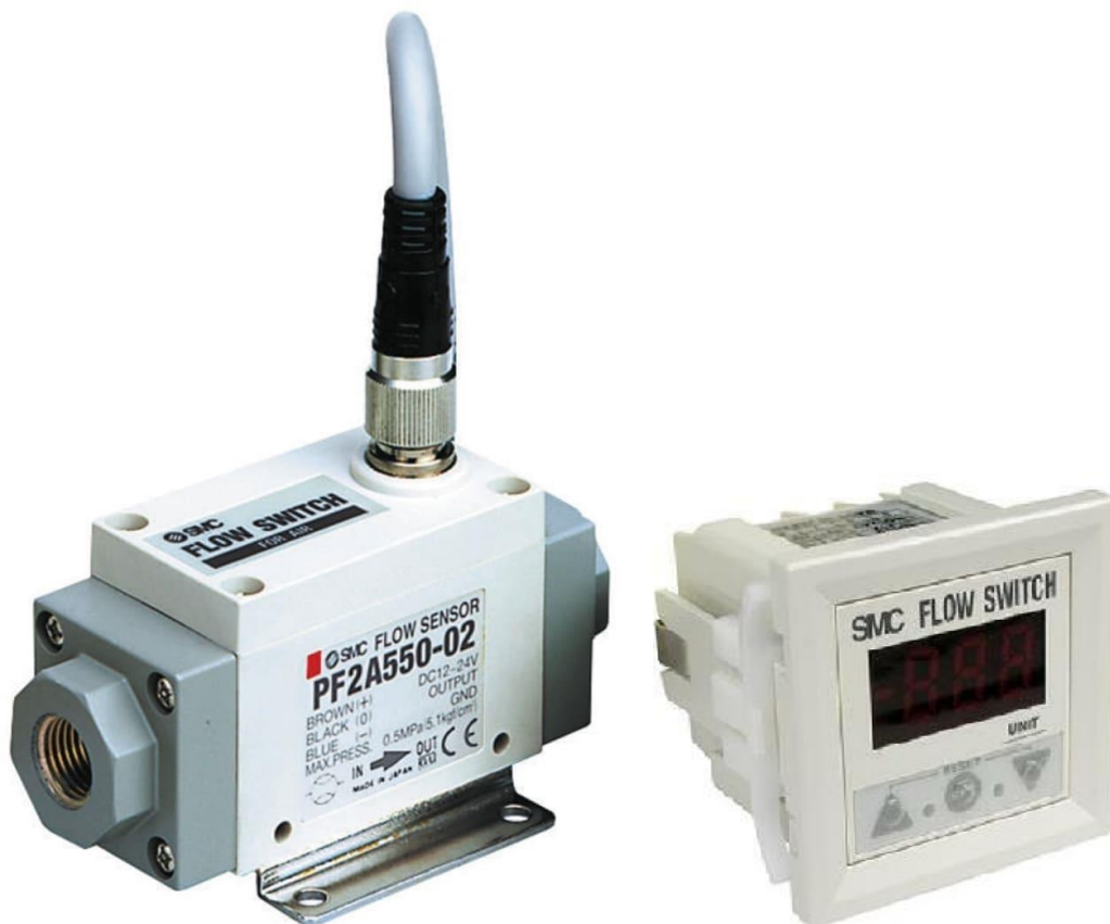
а) Раздельное исполнение

Общий вид расходомеров в зависимости от серии и исполнения представлен на рисунках 2-9.