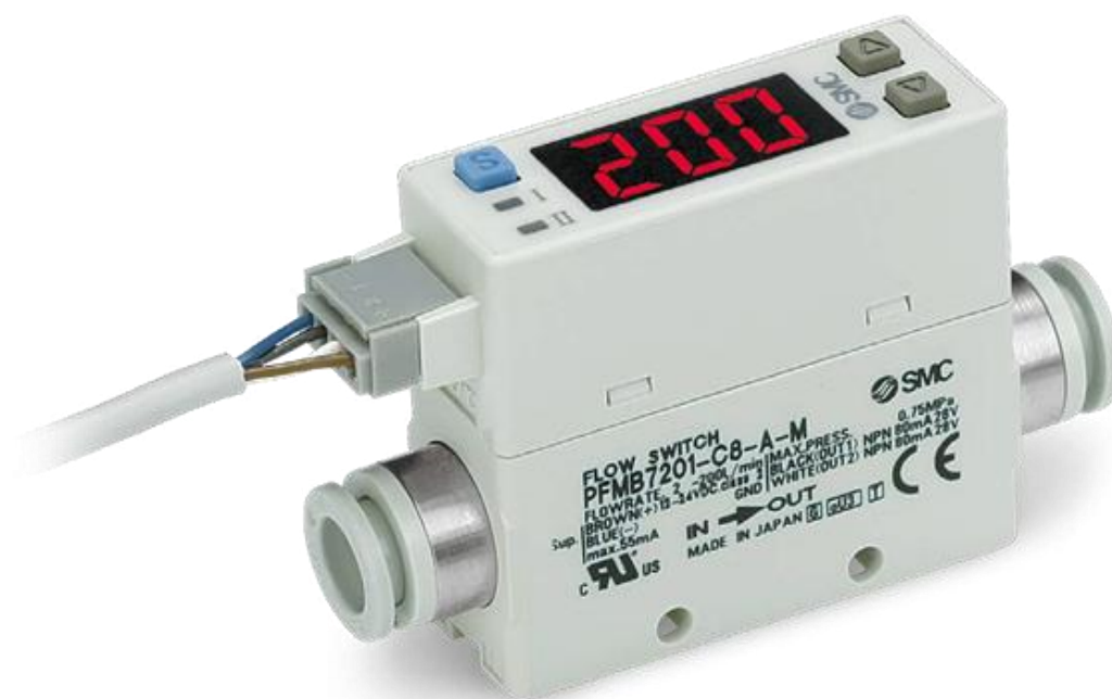
а) Исполнение 7201