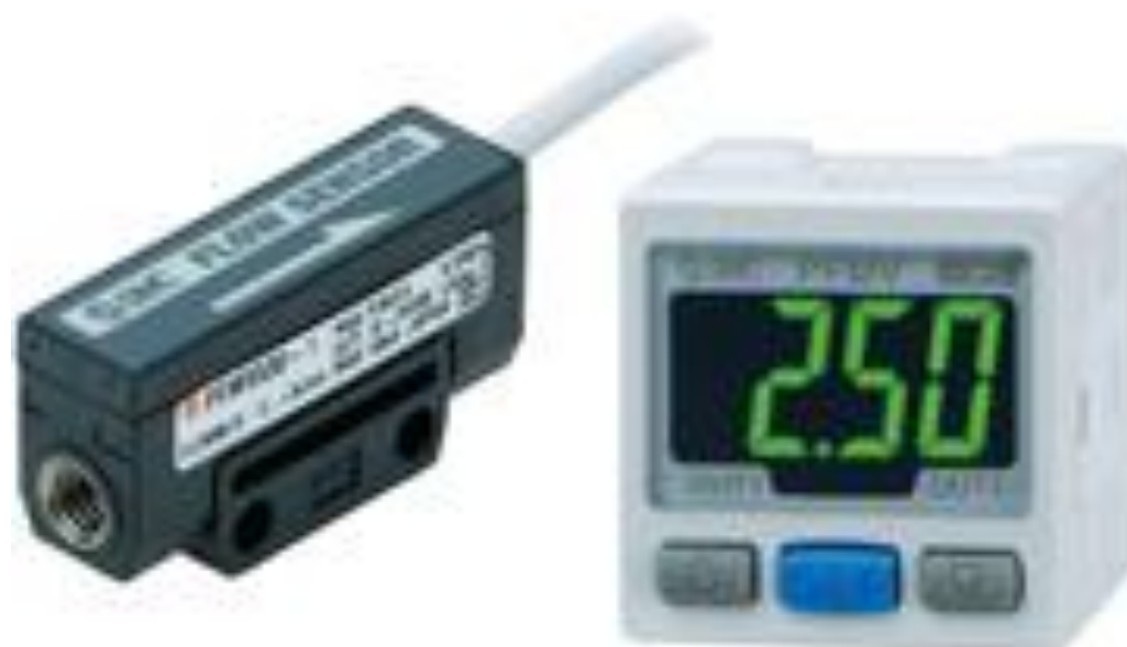
Рисунок 9 — Общий вид расходомеров PFMV

Заводской номер, состоящий из 9 знаков буквенно-цифрового кода, наносится на боковую поверхность корпуса методом гравировки. Заводской номер может иметь дополнительно знаки, отделенные от основных знаков дефисом и объединяющие расходомеры по заказу в одну партию. Места нанесения заводского номера представлены на рисунке 10.