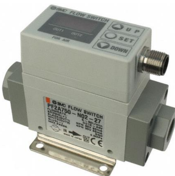
б) Интегральное исполнение