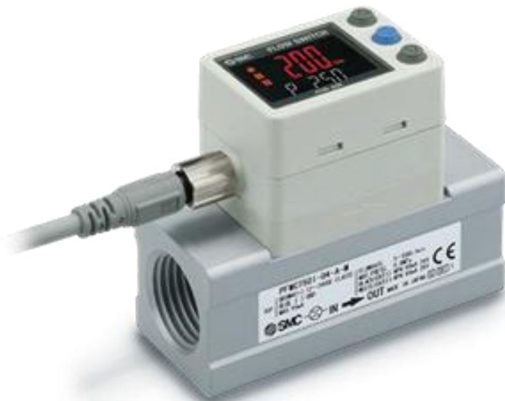
Рисунок 8 — Общий вид расходомеров PFMС