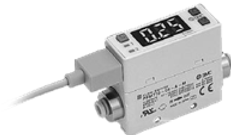
б) Интегральное исполнение