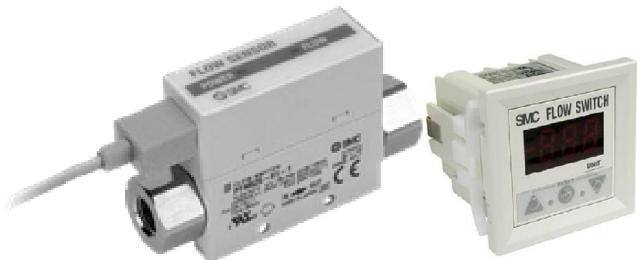
а) Раздельное исполнение