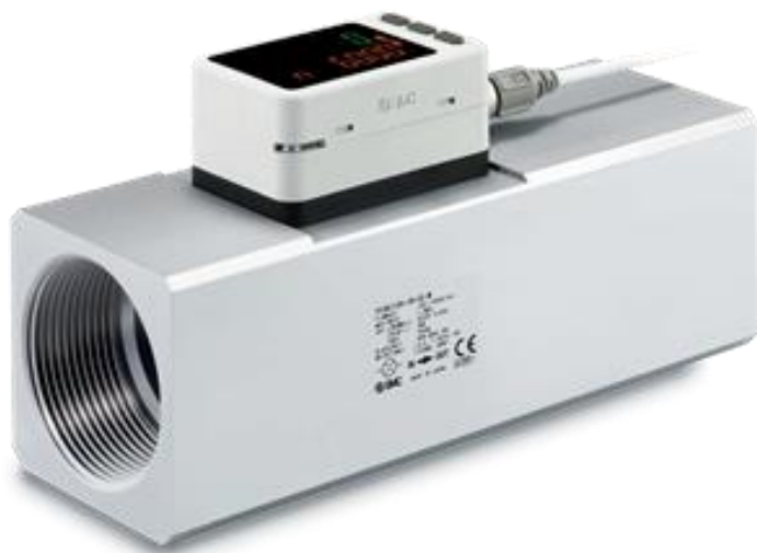
а) Исполнения 701Н, 702Н, 703Н-(L), 706Н-(L), 712Н-(L)