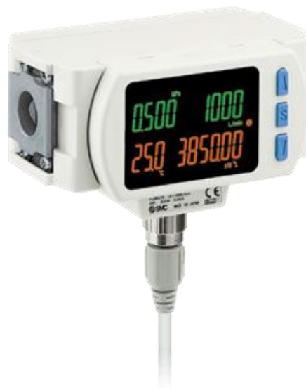
б) Исполнения модульного типа 701Н-(L), 702Н-(L), 801Н-(L), 802Н-(L)