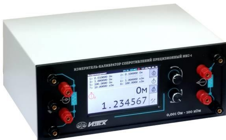
Рисунок 1 - Общий вид калибратора ИКС-1

Для предотвращения от несанкционированного проникновения внутрь калибратора применяются одноразовые разрушающиеся наклейки-пломбы, приклеенные на нижнюю панель. Схема пломбировки представлена на рисунке 3.