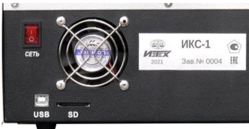
Рисунок 2 – Этикетка со знаком утверждения типа на задней панели калибратора