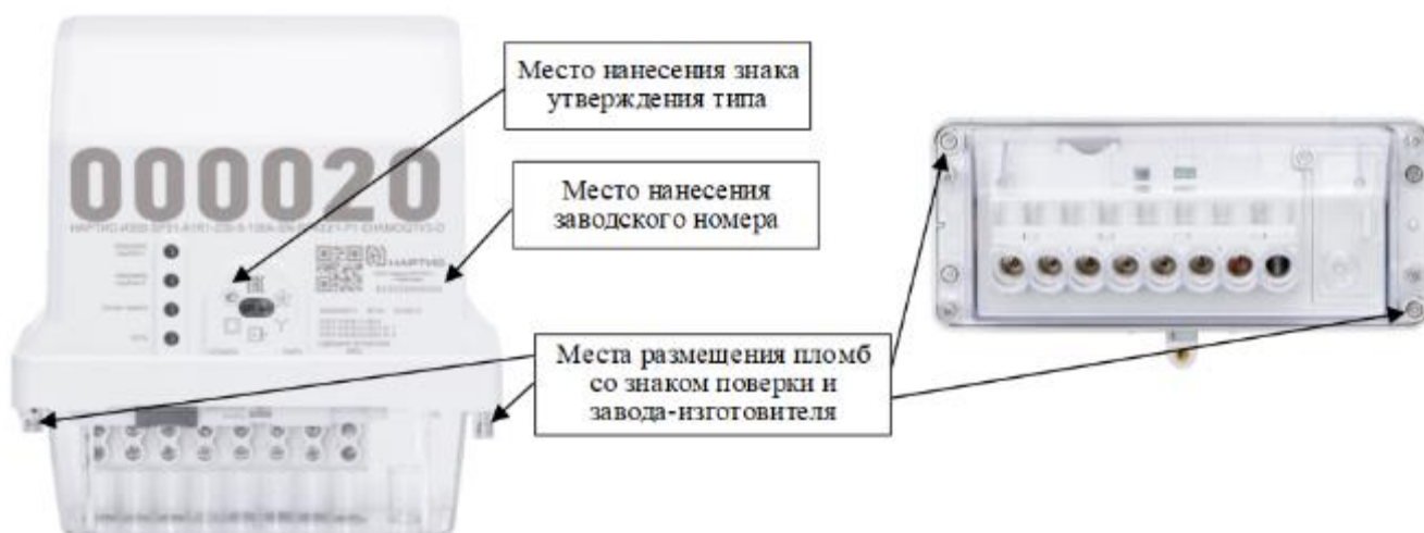
в) блок измерительный счетчиков в корпусе типа SP31