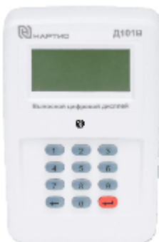
е) выносные цифровые дисплеи НАРТИС-Д101 и НАРТИС-Д101В