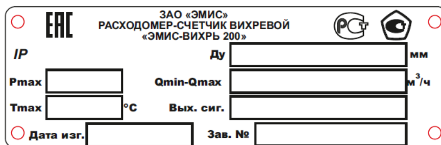
Рисунок 7 - Пример маркировочной таблички