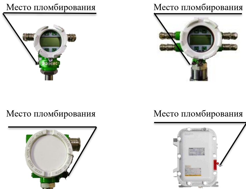
Рисунок 6 - Места нанесения защитных пломб