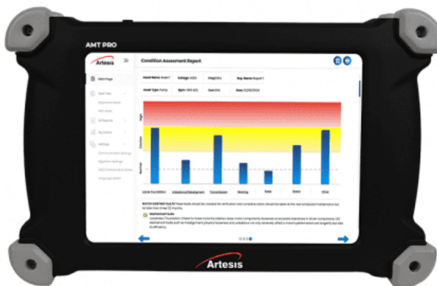
Рисунок 1 – Общий вид систем АМТ Pro