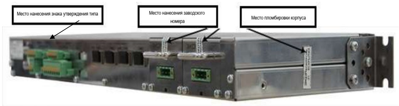
Рисунок 1– Общий вид УСПД с указанием мест нанесения заводских этикеток

Для предотвращения несанкционированного доступа к внутренним частям, производится пломбирование УСПД специальными этикетками, разрушающимися при вскрытии устройства. Общий вид УСПД с указанием мест нанесения заводских этикеток представлен на рисунке 1.