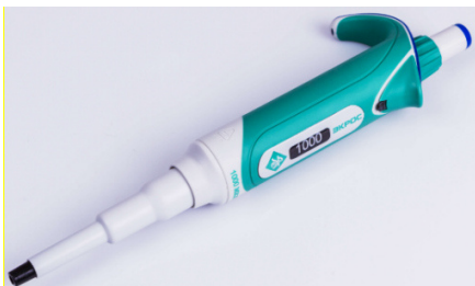
Рисунок 2 – Дозатор пипеточный одноканальный серии ЭКРОС фиксированного объёма, автоклавируемый