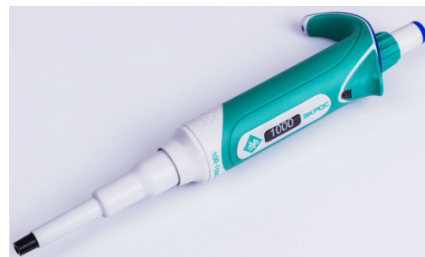
Рисунок 3 – Дозатор пипеточный одноканальный серии ЭКРОС переменного объёма, автоклавируемый