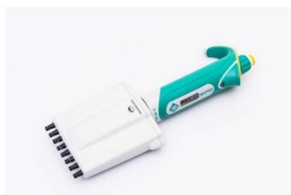
Рисунок 4 – Дозатор пипеточный многоканальный серии ЭКРОС переменного объёма, автоклавируемый