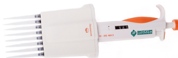
Рисунок 5 – Дозатор пипеточный многоканальный серии ЭКОХИМ переменного объёма