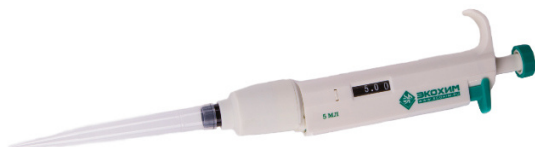
Рисунок 8 – Дозатор пипеточный одноканальный серии ЭКОХИМ фиксированного объёма, автоклавируемый