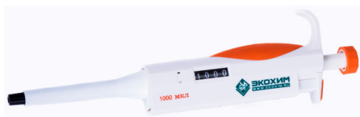
Рисунок 6 – Дозатор пипеточный одноканальный серии ЭКОХИМ фиксированного объёма