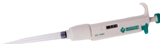
Рисунок 9 – Дозатор пипеточный одноканальный серии ЭКОХИМ переменного объёма, автоклавируемый

Пломбирование дозаторов не предусмотрено. Нанесение знака поверки на средство измерений не предусмотрено.