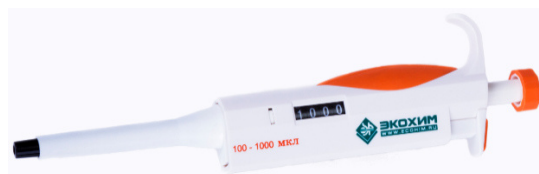
Рисунок 7 – Дозатор пипеточный одноканальный серии ЭКОХИМ переменного объёма