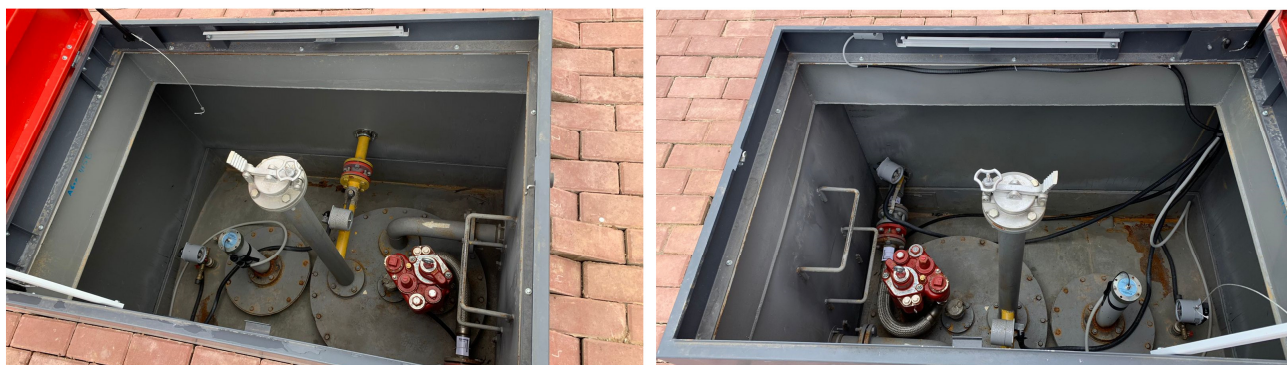
Рисунок 1 – Общий вид резервуара СР 50П

Нанесение знака поверки на средство измерений не предусмотрено.