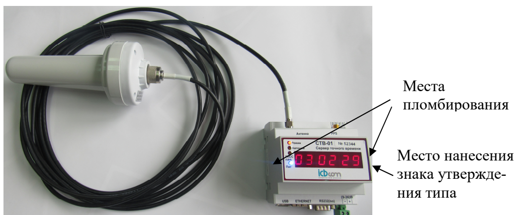
Рисунок 2 – Общий вид исполнения АСНБ.428000.001-02

Знак поверки наносится на свидетельство о поверке.