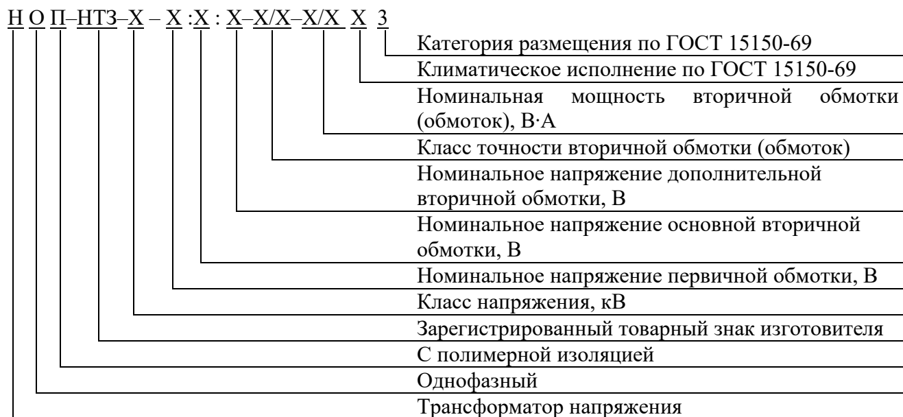
Рисунок 1 – Структура условного обозначения

Трансформаторы относятся к не ремонтируемым и не восстанавливаемым изделиям.