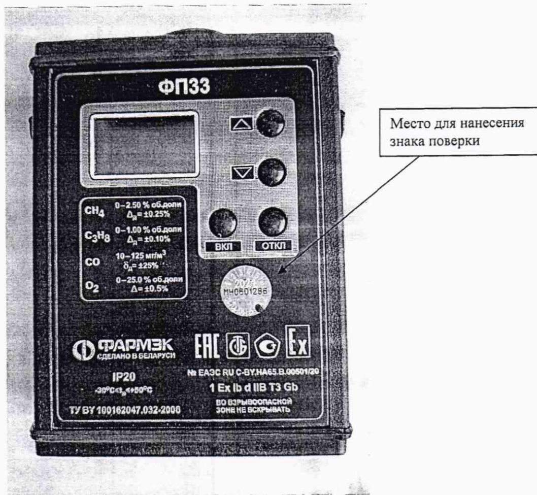
Рисунок 2.1 – Схема с указанием места для нанесения знака поверки

Схема (рисунок) с указанием места для нанесения знака поверки средств измерений