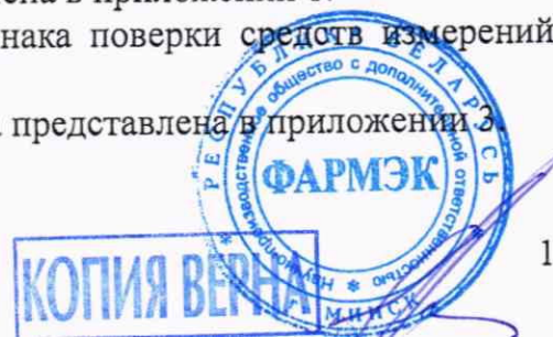
Схема пломбировки от несанкционированного доступа представлена в приложении 3.

Схема (рисунок) с указанием места для нанесения знака поверки средств измерений представлена в приложении 2.