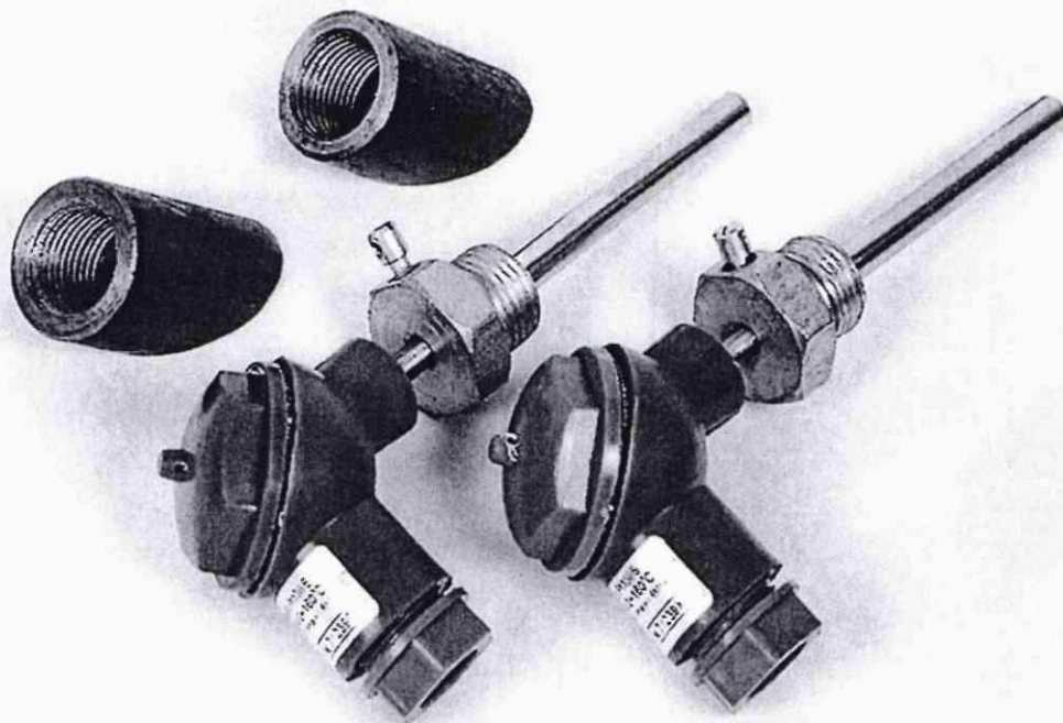
Рисунок 1.1 – Фотография общего вида комплекта ТСПА-К исполнения PL (носит иллюстративный характер)