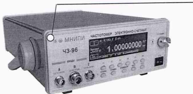
Рисунок 2.1 – Частотомер электронно-счетный ЧЗ-96. Место нанесения знака поверки (клейма-наклейки)