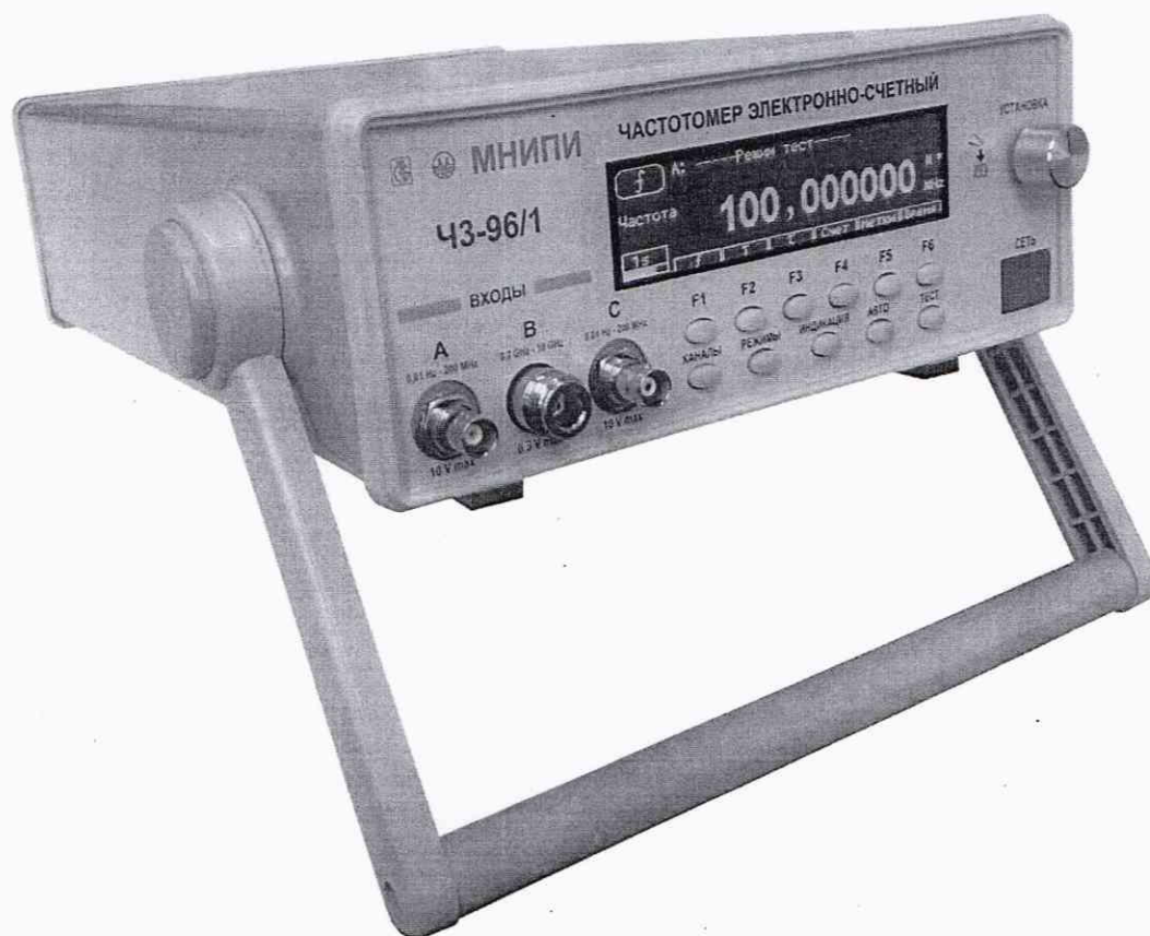
Рисунок 1.2 – Частотомер электронно-счетный ЧЗ-96/1. Внешний вид