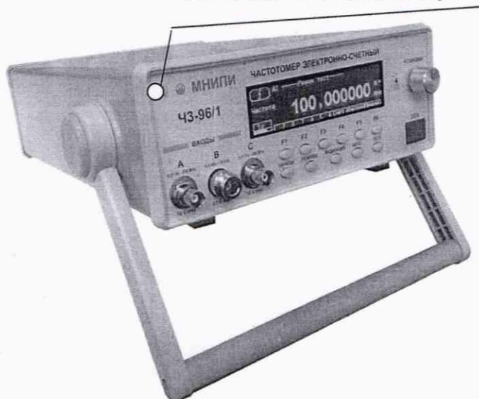
Рисунок 2.2 – Частотомер электронно-счетный ЧЗ-96/1. Место нанесения знака поверки (клейма-наклейки)