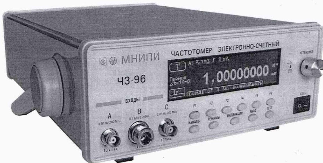
Рисунок 1.1 – Частотомер электронно-счетный ЧЗ-96. Внешний вид

Фотографии общего вида средства измерений