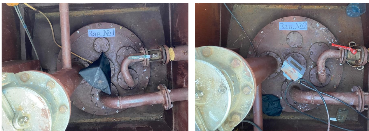
Рисунок 1 – Общий вид резервуаров РГС-25

Нанесение знака поверки на средство измерений не предусмотрено.