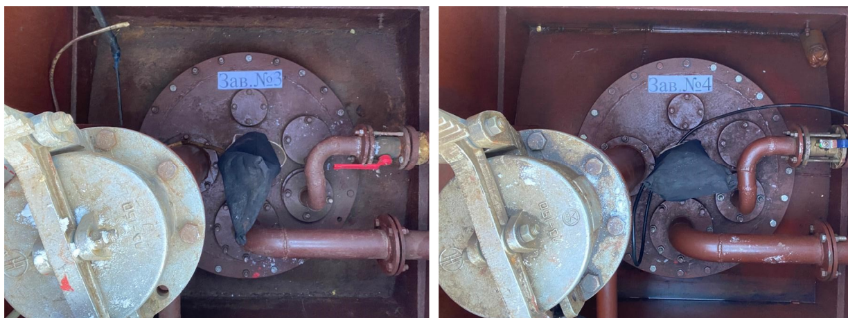
Рисунок 2 – Общий вид резервуаров РГС-25