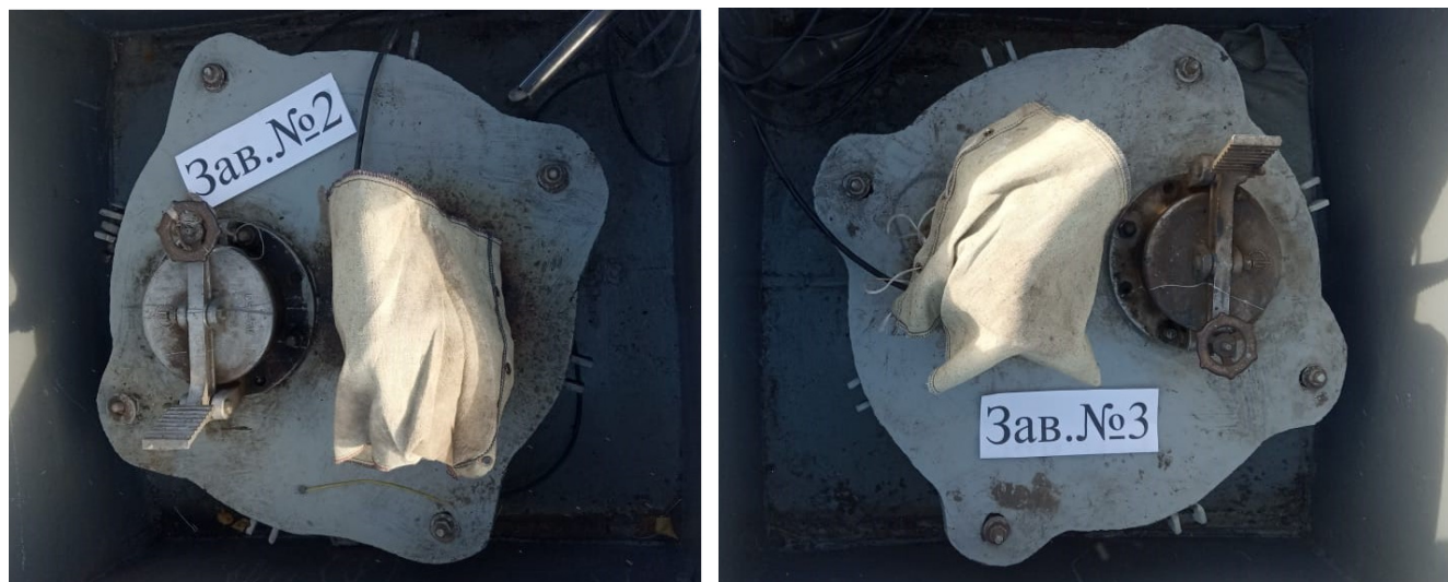
Рисунок 1 – Общий вид резервуаров РГС-60

Нанесение знака поверки на средство измерений не предусмотрено.