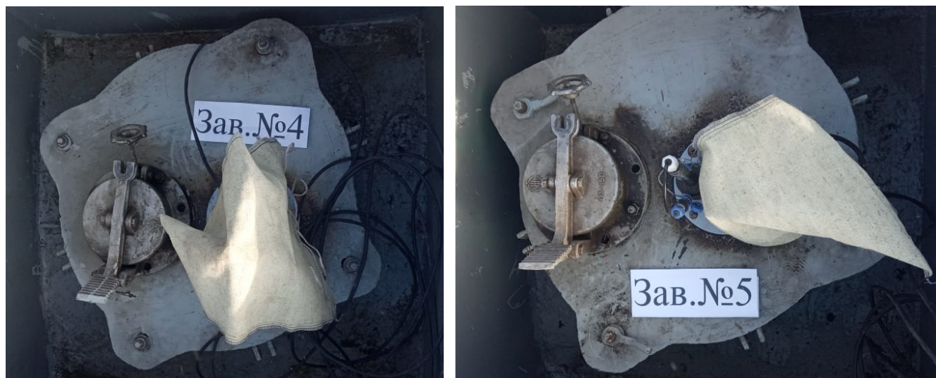
Рисунок 2 – Общий вид резервуаров РГС-60